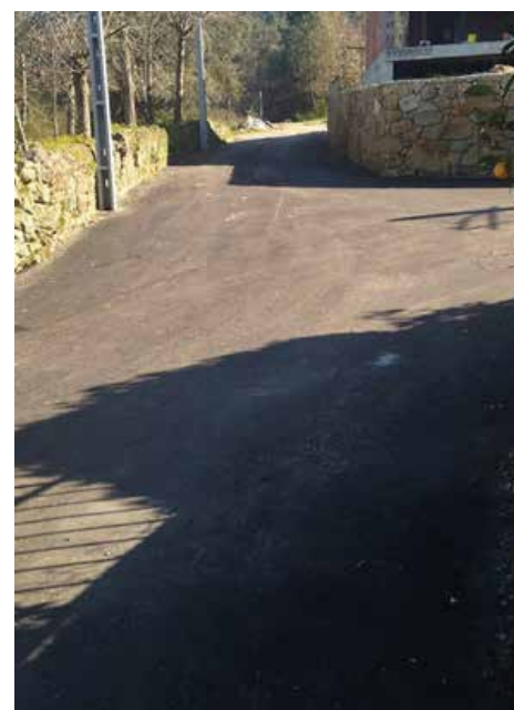
Parte da Rua de Ermige