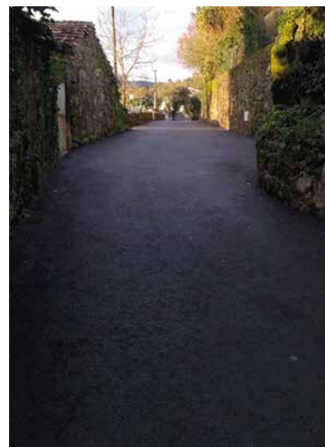
Rua Fonte da Carreira