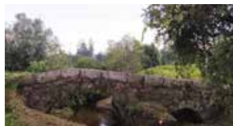
Ponte da Caridade

Nos passados meses de setembro e outubro, foram efetuadas intervenções às pontes da Caridade e de Levandeiras. Na primeira foi efetuado o corte de toda a vegetação envolvente e, na segunda, foi substituída a proteção metálica existente por estar danificada e efetuada a reparação das pedras do tabuleiro da mesma.