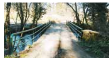
Ponte de Levandeiras