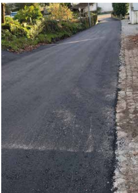
Parte da Calçada de Grimancinhos