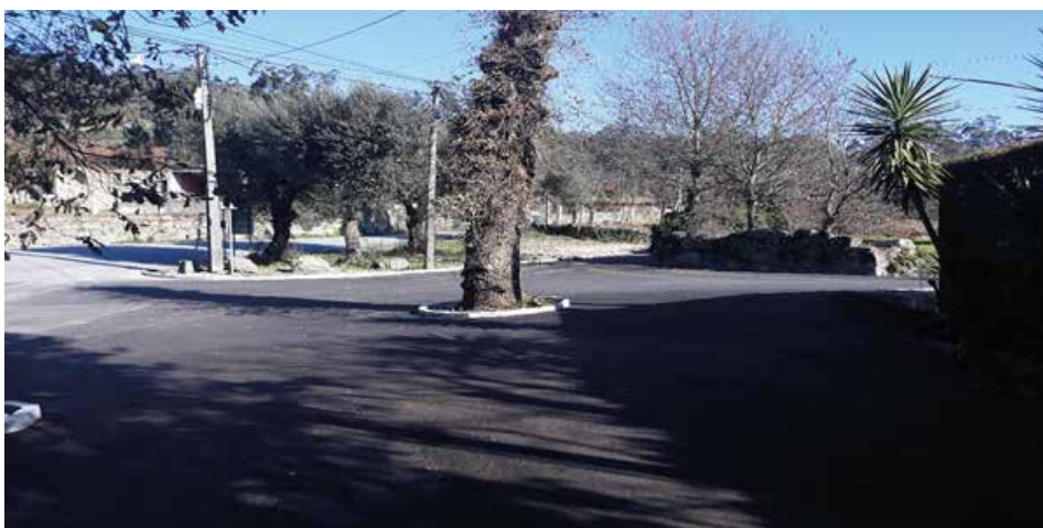
Parte da Rua de Grimancinhos