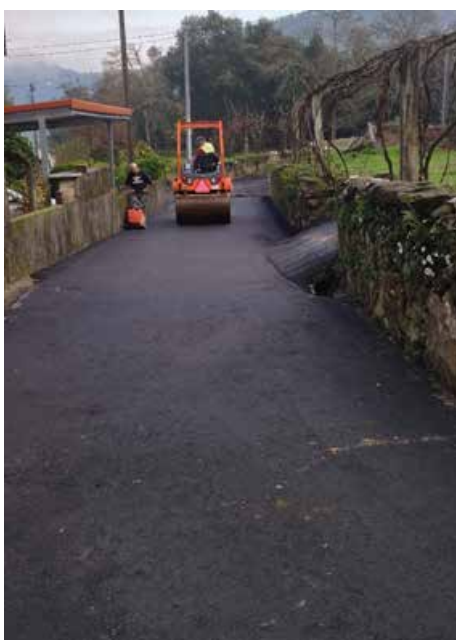
Travessa de Casas Novas

Desde já a Junta de Freguesia agradece aos Cossouradenses a cedência de terreno para ser possível os alargamentos.