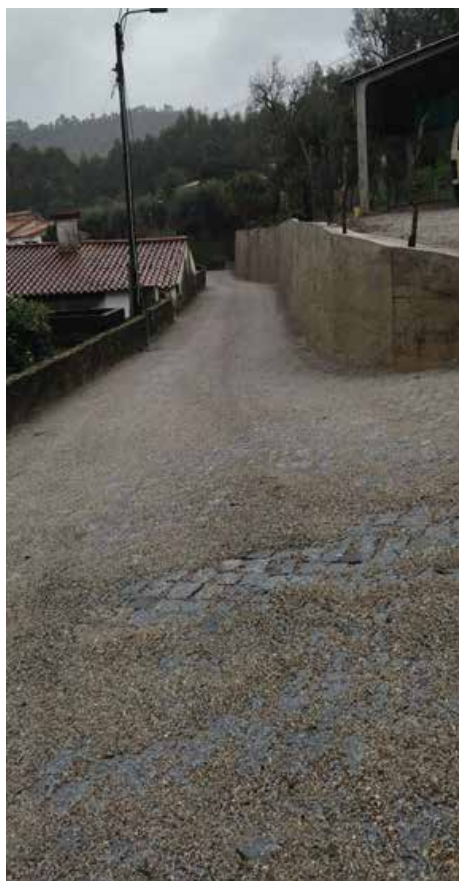
Parte da Rua da Tomadia